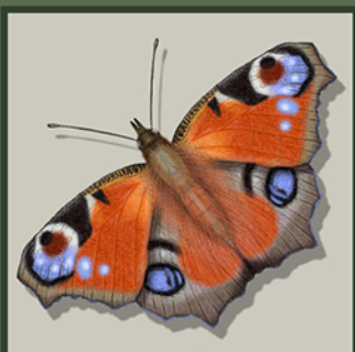
Mariposa Pavo real